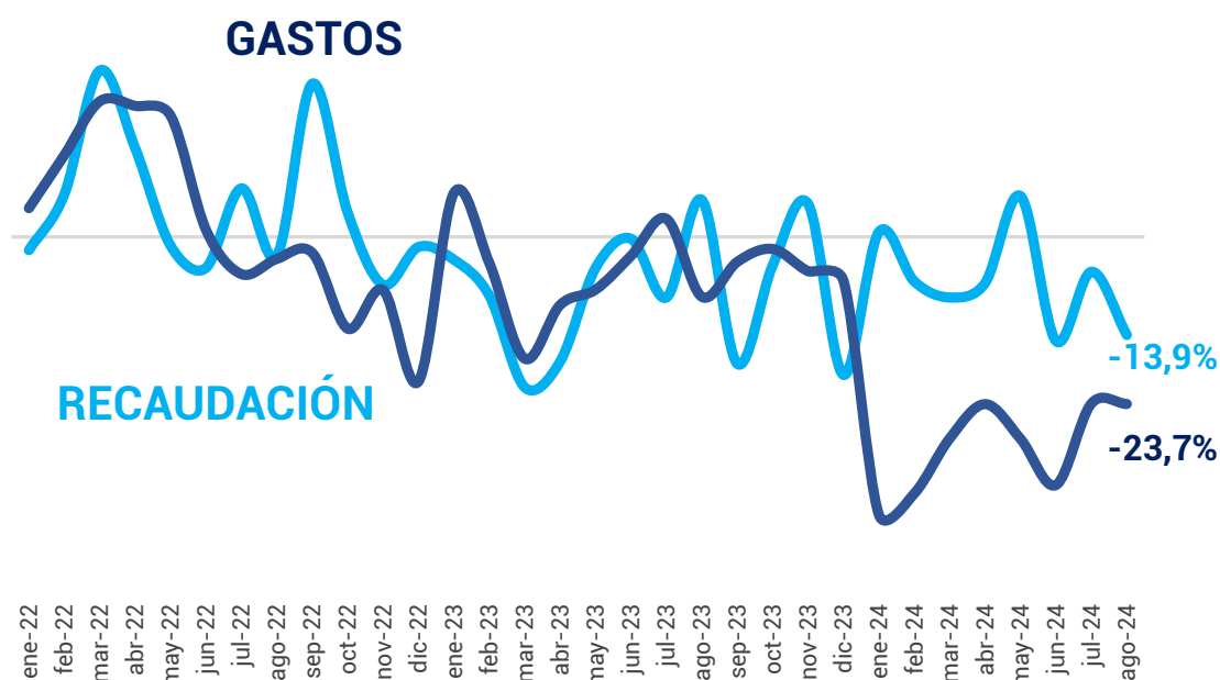
Gráfico 1. Variación real interanual (en porcentaje) de los ingresos totales y gastos primarios. Enero 2022 – agosto 2024